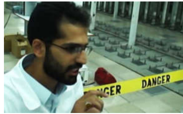
Nətənz nüvə obyektı