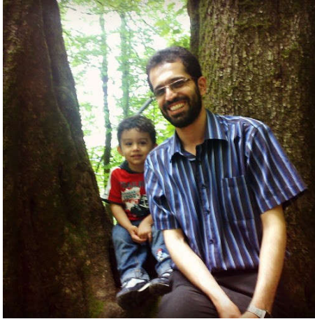
Mustafanın uşaqlığından onun Əlirzasının uşaqlığına qədər