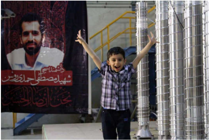
Atanın yolu davam edir...