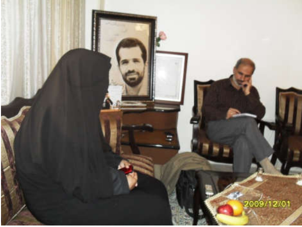
Şəhidin evində müsahibə görüşləri