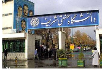
Şərif Texnologiya Universiteti