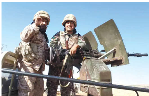
Rəsul Cəfəri Suriyada